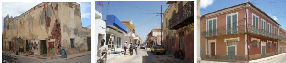
Renouveau urbain en centre ville historique

Valorisation de l'héritage historique et patrimonial