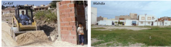
Interventions en quartiers précaires