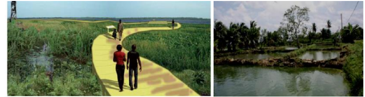
Aménagements autour de trames vertes et bleues

Valorisation de l'héritage historique et patrimonial