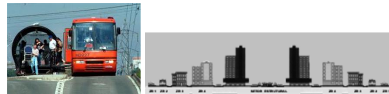
Transit Oriented Development (TOD)

Respectant les principes des éco-référentiels