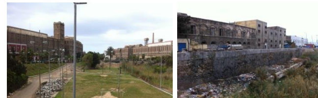
Réhabilitation de friches industrielles