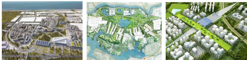
Extension urbaine et villes nouvelles

Respectant les principes des éco-référentiels